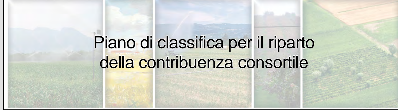
Tavola 5 Classi di uso del suolo